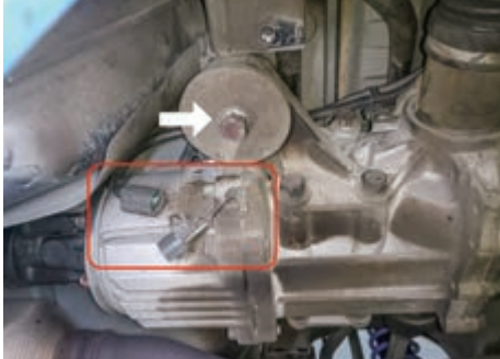
箭頭處：拆下螺絲 紅框處：拆除連接插頭