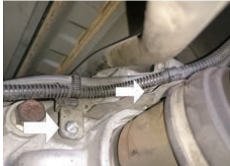
箭頭處：拆除線路固定支架