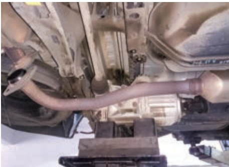
建議使用變速箱千斤頂工具，以策安全