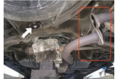
箭頭處：拆下螺絲 紅框處：拆卸排氣管連接尾段位置